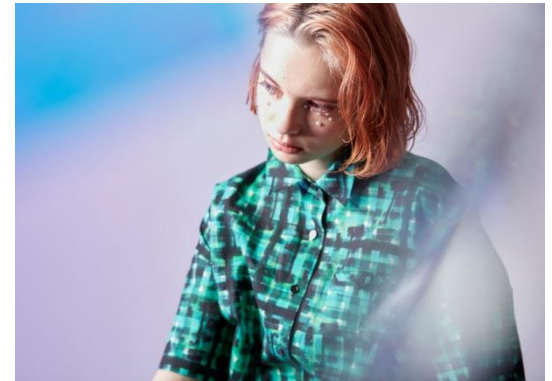
PHOTO : 2022 SS Collection